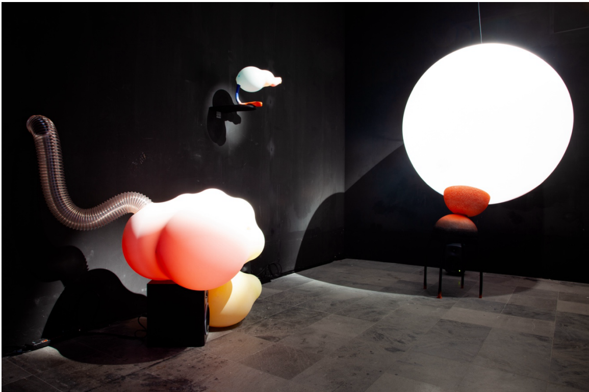
作品： 細胞獨白 Cell Soliloquy 2025